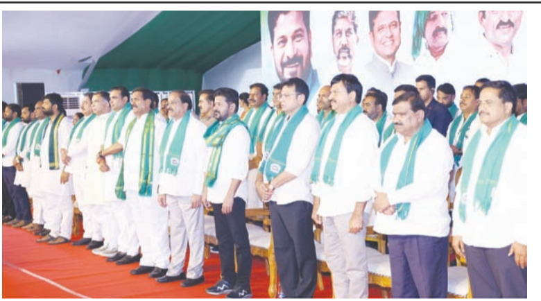
నేకూర్చేందుకు టమాటా సాఫ్ తయారీ పరిశ్రమను ఏర్పాటు చేయనున్నట్లు ప్రకటించారు.

మరో ప్రతిష్టాత్మక గుర్తింపుగా కోపాడ ప్రాజెక్ట్ మార్కెట్ నిలుస్తుందని సీఎం పేర్కొన్నారు. ఈ ప్రాజెక్టుకు అవసరమైన నిధులను గ్రీన్ ఛానల్ ద్వారా విడుదల చేస్తామని, ఈ ఏడాది డిసెంబర్ నాటికి మార్కెట్ కార్యక్రమాల పాలు ప్రారంభించేలా అధికారులు చర్యలు తీసుకోవాలని ఆదేశించారు. రెండేళ్లలో పూర్తి స్థాయి ప్రాజెక్టును ప్రజలకు అందుబాటులోకి తీసుకురావాలని సూచించారు. రైతులకు మార్కెటింగ్, ప్రాసెసింగ్ సదుపాయాలు వ్యవసాయం లాభసాటిగా మారాలంటే పంటల ఉత్పత్తితో పాటు మార్కెటింగ్, కోల్డ్ స్టోరేజీ, ప్రాసెసింగ్ సదుపాయాలు కల్పించాల్సిన అవసరం ఉందన్నారు. ఈ క్రమంలో కందుకూరు ప్రాంత టమాటా రైతులకు మేలు