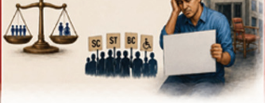
అనంతపురం - సూర్య వార్తాపత్రం

ఎన్నో ఏళ్లుగా ఎదురు చూసిన విశ్వవిద్యాలయాల పోస్టుల నోటిఫికేషన్ రానే వచ్చింది. నోటిఫికేషన్ తో పాటు గందరగోళం ఎక్కువగా ఉంది. రిజిస్ట్రేషన్ ప్రక్రియ చాలా సులభంగా ఉంది. నియామకాలు సెంట్రలైజ్ పద్ధతిలో చేస్తారా లేక ఏ యూనివర్సిటీ వారు నియామకాలు చేపడతారా అన్న ప్రశ్న తలెత్తుతుంది. నియామకాలు ఎవరికి వారే యమనా తీరే అన్నట్లు ఉంది. గతంలో విశ్వవిద్యాలయాలకు ఇచ్చిన నోటిఫికేషన్లు అన్నీ పాలకమండలి సమావేశాలు పెట్టి రద్దు చేశారు. అప్పుడు రిజిస్ట్రేషన్ రుసుము వేలకు వేలు తీసుకొని అతి గతి లేదు. కట్టిన డబ్బు వాపస్ గురించి వలుమార్చు విశ్వవిద్యాలయ అధికారులకు విన్నవించుకున్నా ప్రయోజనం లేదు. ఇప్పుడు అన్ని విశ్వవిద్యాలయాలకు ఒకే పోర్టల్ ద్వారా అప్లై చేసుకోమని వెబ్సైట్ లో పొందుపరిచారు. అసిస్టెంట్ ప్రొఫెసర్ లకు పరీక్షలు నిర్వహిస్తున్నారు. దీనికి ఒక పోస్టుకు 2500 రూపాయలు, అసోసియేట్ ప్రొఫెసర్స్, ప్రొఫెసర్ డైరెక్టర్ లైబ్రేరియన్ పోస్టుకు 3000. ఒక అభ్యర్థి ఐదు విశ్వవిద్యాలయాలకు అప్లై చేస్తే 15000 రూపాయలు సమర్పించుకోవాలి. పరీక్షలు ఇంటర్వ్యూ నిర్వహించే పోస్టుకు 2500 పెట్టి కేవలం ఇంటర్వ్యూ నిర్వహించే పోస్టుకు 3000 ఏ ప్రాతిపదికన పెట్టారో అర్థం కావడం లేదు. ఒకవేళ ఈ ప్రక్రియ రద్దయితే వారికి డబ్బు వాపస్ ఇస్తామన్న గ్యారంటీ లేదు. లాటరీలో అర్హుల వెతుకుతున్నట్లు అభ్యర్థులు కూడా ఎండవూలను సమ్ముకుంటున్నారు. గతంలో కట్టిన రుసుము ఇప్పటి నోటిఫికేషన్ కు సర్కారి, లేదా అప్పుడు వసూలు చేసిన డబ్బు వాపసు ఇవ్వాలి. లేదంటే అప్పటి ఉన్నత విద్య అధికారులపై తక్షణమే శాఖాపరమైన దర్యాప్తు జరిపి జైలుకు వంపాలి. 2023 లో ఇచ్చిన