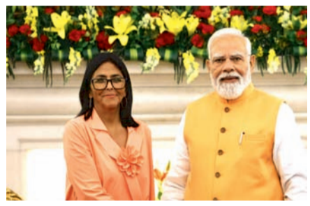
మోడీతో చర్చలు జరిపారు. ఇంధనం, వాణిజ్యం, పెట్టుబడుల రంగాల్లో ద్వైపాక్షిక సంబంధాలను మరింత బలోపేతం

న్యూఢిల్లీ - సూర్య వాస్తవం ప్రస్తుతం మన దేశంలో పర్యటిస్తున్న వెనిజులా తాత్కాలిక అధ్యక్షురాలు డెబ్బీ రౌడ్రిగజ్ తో గురువారం ప్రధాని నరేంద్ర మోడీ భేటీ అయ్యారు. బుధవారం ఇక్కడకు వచ్చిన రౌడ్రిగజ్ గురువారం హైదరాబాద్ హాస్ లో ప్రధాని