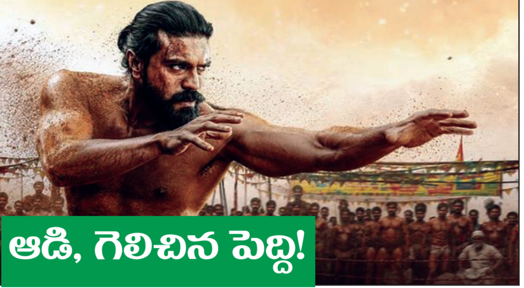
ఆడి, గెలిచిన పెద్ది!

మూడు ఆటల్లోనూ విభిన్నంగా .... ఈ సినీమా రామ్ చరణ్ వనస్పాటి షోగా చెప్పుకోవచ్చు. క్రికెటర్ గా, కుస్తీ ఆటగాడిగా, అడ్వెంట్ గా మూడు విభిన్నమైన పాత్రలతో కనిపించిన చరణ్, ప్రతి పాత్రలోనూ వైవిధ్యం చూపింది ఆకట్టుకున్నారు. ఈ