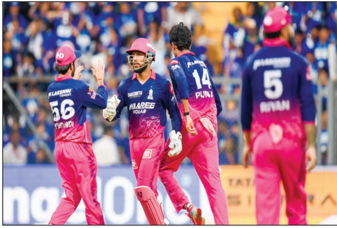
నాటౌట్ మెరుపు వేగంతో పరుగులు సాధించి జట్టు స్కోరును 200 దాటించారు.