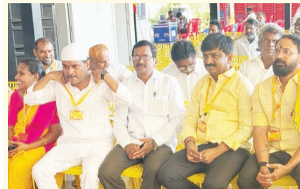
పులివెందుల -సూర్య వాస్తవం:

- ఎన్టీఆర్ ఆశయాల సాధనకే మహానాడు లక్ష్యం - పండుగను లైవ్లో వీక్షించిన టీడీపీ శ్రేణులు!