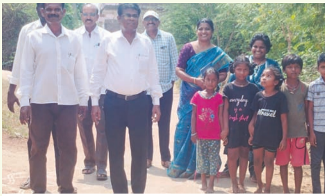
అప్పటికప్పుడే 4 అడ్మిషన్లు

ఈ బడిబాట ప్రచారంలో భాగంగా ఒకటి తరగతి చేరే వయస్సు ఉన్న బడికడు పిల్లలను, అలాగే ప్రస్తుతం ప్రైవేట్ పాఠశాలల్లో చదువుతూ ఆర్థిక భారం మోస్తున్న విద్యార్థులను అధికారులు ప్రత్యేకంగా గుర్తించారు నేరుగా వారి ఇళ్లకు వెళ్లి, తల్లిదండ్రులతో సానుకూల వాతావరణంలో మాట్లాడి, వారిని ఒప్పించి మెప్పించారు దాంతో నలుగురు విద్యార్థులను తక్షణమే ప్రభుత్వ పాఠశాలలో చేర్పించు కుంటూ స్కూల్ అడ్మిషన్లు పూర్తి చేశారు అదేవిధంగా, బంగారం పేటలో గుర్తించిన మరో ఎనిమిది మంది