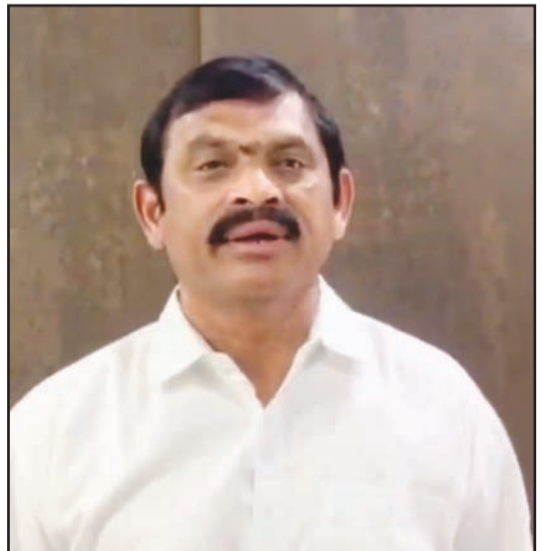
అవినీతి లేకుండా, కేవలం ప్రతిభ ఆధారంగానే దాదాపు 16 వేలకు పైగా ఉపాధ్యాయ పోస్టులను అత్యంత తక్కువ సమయంలో భర్తీ చేయడం జరిగిందని స్పష్టం చేశారు. గత