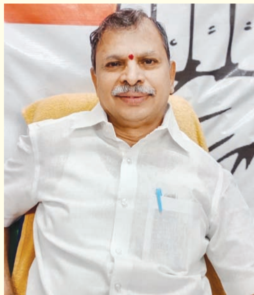
ఆడబిడ్డకు నెలకు 1500 రూపాయలు అర్థిక సహాయం చేస్తామని సూపర్ సిక్స్ హామీలో చెప్పబడింది. ఇంతవరకు అమలు కాలేదు. బీసీ, ఎస్సీ, ఎస్టీ, ముస్లిం