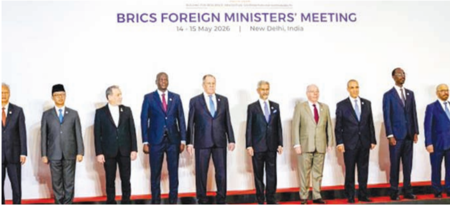
BRICS FOREIGN MINISTERS' MEETING 14-15 May 2026 | New Delhi, India