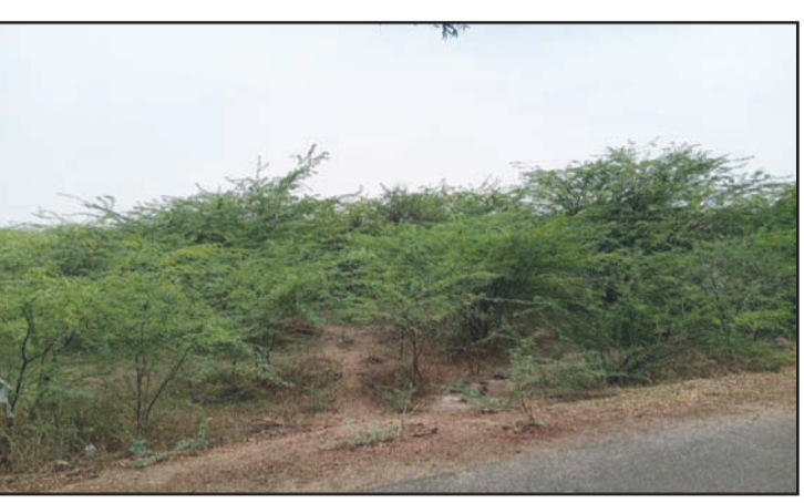
గుంటూరు వంటి తీర ప్రాంతాల్లో నదీ ప్రవాహాలు, సాగు కాలువలు కూడా ఈ మొక్క కొత్త ప్రాంతాలకు చేరేందుకు సహకరిస్తున్నాయి.

అసంతృప్తం - సూర్య వార్తాపత్రిక : ఆంధ్రప్రదేశ్లో విస్తారమైన భూభాగాలు వేగంగా విస్తరిస్తున్న ఆక్రమణ కారి జాతి ప్రోసోపిస్ జులిఫ్టోరా చేత క్రమంగా ఆక్రమించబడుతున్నాయి. ఈ ముళ్లతో నిండిన దట్ట మైన పొదలు ప్రస్తుతం పర్యావరణానికి, గ్రామీణ జీవనాధారాలకు తీవ్రమైన మార్పుగా మారుతున్నాయి. ప్రభావిత ప్రాంతాల్లో నిర్వహించిన క్షేత్ర పరిశీలనలు, దృశ్య ఆధారాలు ఈ మొక్కలు దట్టమైన, దాటలేనంతగా పెరిగిన పొదలుగా విస్తరించాయని వెల్లడిస్తున్నాయి. సాధారణంగా "విలాయతి బాబుల్" లేదా "సీమ కరువేలం"గా పిలిచే ఈ మొక్కలు వదులైన ముళ్లు, సన్నని ఆకులు, బీన్స్ ఆకారపు కాయలతో ప్రత్యేకంగా కనిపిస్తాయి. ఎండ అర్ధ ఎండ ప్రాంతాల్లో ఇవి ఒకే రకంగా వేగంగా వ్యాపించడం పర్యావరణ సమతౌల్యానికి ప్రమాదకర సంకేతమని నిపుణులు హెచ్చరిస్తున్నారు. సున్నిత ప్రాంతాల్లో దూకుడైన విస్తరణలకు అనుకూలమైన జిల్లాలో అసంతృప్తం, కర్రలూతో పాటు తీర ఆంధ్రాలో పాదుబడ్డ భూములు, గనుల ప్రాంతాలు, కాలువ గట్టుల వరకు ఈ మొక్క విస్తరించింది. కడప జిల్లా మంగంపేటలో గనుల వృద్ధ ప్రాంతాలను ఇది పూర్తిగా ఆక్రమించడం కాకుండా, నేలలోని భారీ లోహాలను కూడా శోషించగల సామర్థ్యాన్ని ప్రదర్శిస్తోంది. పర్యావరణవేత్తల ప్రకారం, కర్రపు పరిస్థితులు పశువుల సంచారం ఈ మొక్కల వ్యాప్తిని మరింత వేగవంతం చేస్తున్నాయి. పశువులు తెలియకుండానే విస్తరణలను వ్యాపింపజేస్తున్నాయి. కృష్ణా,