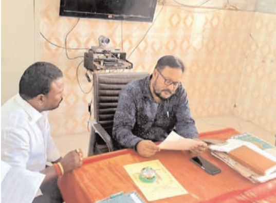
పొందుతున్నప్పటికీ వారికి ప్రత్యేక భవనం లేక ప్రస్తుతం సమీప ప్రాథమిక పాఠశాల భవనంలోని ఒక గదిలో కార్యకలాపాలు నిర్వహించాల్సి వస్తోందన్నారు. ఈ పరిస్థితి చిన్నారులకు ఇరుకుగా మారి, వారి ఆరోగ్యం మరియు విద్యాభ్యాసంపై ప్రతికూల ప్రభావం చూపుతోందని ఆవేదన వ్యక్తం చేశారు. ఇటీవల సూల్ విలీనం జరగడంతో విద్యార్థులు, ఉపాధ్యాయుల సంఖ్య