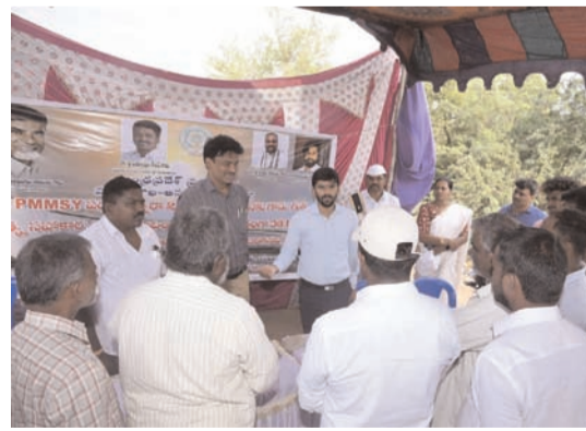
మెరుగైన ఫిష్ మార్కెట్ సౌకర్యం కావాలని కోరారు. అలాగే రిజర్వాయర్లలో చేపల పెంపకానికి ఉన్న అవకాశాలను పరిశీలించమని కోరగా, అదిశగా తగిన చర్యలు తీసుకుంటామన్నారు. మత్స్యకారుల అవసరాలను బట్టి వారికి తగిన సహకారం అందిస్తే వారి జీవనాధారం మెరుగుపడుతుందని సూచించారు. గుత్తి మత్స్య సహకార సంఘం సాధించిన ప్రగతికి