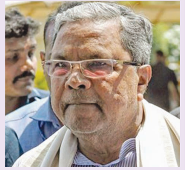
- మిగతా 2లో..

బెంగళూరు - సూర్య వాస్తవం మేడే నాడు 19 కేజీల వాణిజ్య ఎలీపిజి గ్యాస్ సిలిండర్ ధర రూ. 993కి పెరిగింది. దీంతో ఈ సిలిండర్ ధర రూ. 3,071కి చేరింది. ఎన్నికల తర్వాత.. అదీ మేడే నాడే గ్యాస్ సిలిండర్ ధర కేంద్రం పెంచడాన్ని కర్ణాటక ముఖ్యమంత్రి సిద్ధరామయ్య ఫైర్ అయ్యారు. కార్మిక వర్గానికి మేడేనాడు మోడీ ఇచ్చిన గిఫ్ట్ అని ఆయన అభివర్ణించారు. మోడీ ప్రభుత్వం వ్యవస్థీకృత డోపిడికి పాల్పడుతుందని సిద్ధరామయ్య తీవ్రంగా విమర్శించారు. ఈ మేరకు ఆయన సామాజిక మాధ్యమం ఎక్స్ లో పోస్టు చేశారు. మేము మొదటి నుండి హెచ్చరిస్తున్నట్లే, అసె - ంట్లీ ఎన్నికలు ముగిసిన వెంటనే సరేంద్ర మోడీ ప్రభుత్వం మళ్లీ ధరలను పెంచింది. ఎన్నికల సమయంలో ఉద్దేశపూర్వకంగానే ఇటువంటి పెంపులను