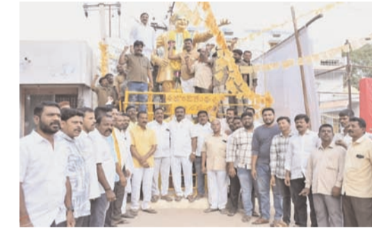
కత్తులలో కార్మికుల సంక్షేమం కోసం అనేక కార్యక్రమాలు అమలు చేస్తున్నామని వివరించారు. ఆటో కార్మికులకు ఆర్థిక సహాయం, చేనేత కార్మికులకు ప్రోత్సాహకాలు, విద్యుత్ సబ్సిడీలు వంటి పథకాలను ప్రభుత్వం అందిస్తున్నదన్నారు. అసంఘటిత కార్మికుల సంక్షేమంలో కూడా రాష్ట్రం ఇతర రాష్ట్రాల కంటే ముందంజలో ఉందని, కేంద్ర ప్రభుత్వం కూడా ఈ అంశంపై ప్రత్యేక శ్రద్ధ చూపుతోందని తెలిపారు. కార్మికులు, శ్రామికు లందరూ మెరుగైన జీవితాలు గడపాలని, వారి