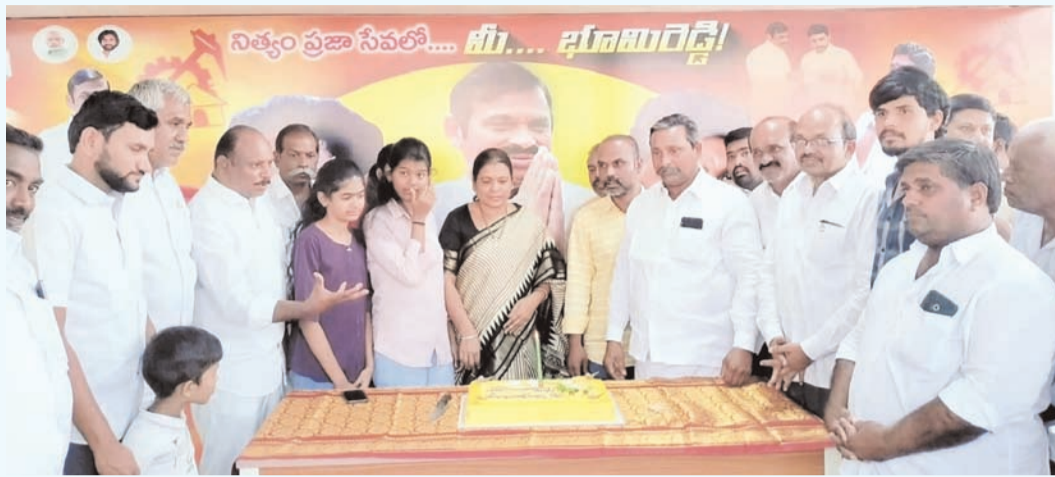
తీసుకొస్తూ రాష్ట్ర ప్రజలకు భరోసా కల్పిస్తున్నారు అన్నారు. ఎన్నికల్లో ఇచ్చిన సూపర్ సిక్స్ హామీలను తూచా తప్పకుండా అమలు చేసిన ఘన చరిత్ర కూటమి ప్రభుత్వానికి అన్నారు. ఇంటికొక పారిశ్రామికవేత్తను తయారుచేయాలని లక్ష్యంతో ముందుకెళ్తున్నామన్నారు. అలాగే ప్రజా నాయకుడు, అన్న ఎన్టీఆర్ ఆశయాలు అందిపుచ్చుకొని కూటమి పాలన సాగుతుందన్నారు. ఈ కార్యక్రమంలో పార్టీ నాయకులు, కార్యకర్తలు పాల్గొన్నారు.