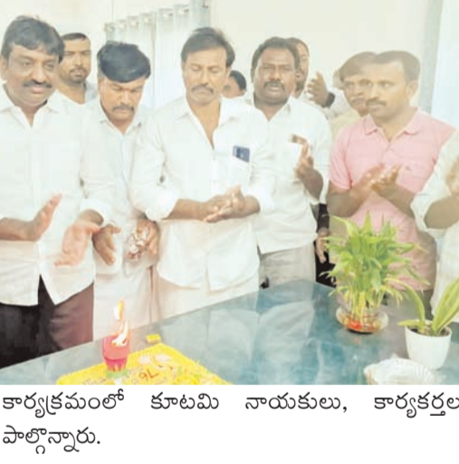
కార్యక్రమంలో కూటమి నాయకులు, కార్యకర్తలు పాల్గొన్నారు.