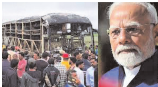
మంత్రాలయం -సూర్యవాస్తవం, ఏప్రిల్ 16 :

కర్నూలు జిల్లా మంత్రాలయం సమీపంలో జరిగిన ఘోర రహదారి ప్రమాదం ఎనిమిది కుటుంబాల్లో తీవ్ర విషాదాన్ని నింపింది. గురువారం తెల్లవారుజామున మంత్రాలయం మండలం చిలకలడోన సమీపంలో యాత్రికులతో వెళ్తున్న బొలెరో వాహనం ఎదురుగా వస్తున్న ట్యాంకర్‌ను ఢీకొట్టడంతో ఈ దుర్ఘటన చోటుచేసుకుంది. పోలీసుల వివరాల ప్రకారం, కర్ణాటక రాష్ట్రంలోని చిక్‌మంగళూరు ప్రాంతం నుంచి శ్రీ రాఘవేంద్ర స్వామి దర్శనార్థం మంత్రాలయానికి బయలుదేరిన యాత్రికులు బొలెరో వాహనంలో ప్రయాణిస్తున్నారు.