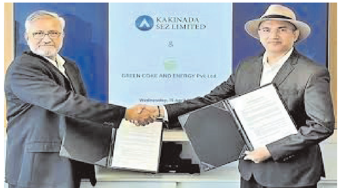
కాకినాడ -సూర్యవాస్తవం, ఏప్రిల్ 16 :

రాష్ట్రంలో పారిశ్రామిక పెట్టుబడులను ఆకర్షించేందుకు ప్రభుత్వం చేస్తున్న ప్రయత్నాలు సత్ఫలితాలనిస్తున్నాయి. ఈ క్రమంలో కాకినాడ ప్రత్యేక ఆర్థిక మండలి పరిధిలో