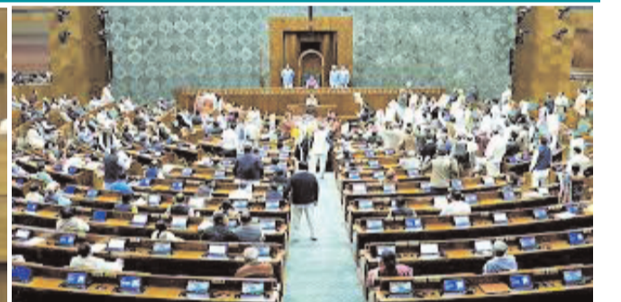
సూర్యవాస్తవం, ఏప్రిల్ 16 :

పార్లమెంట్ ప్రత్యేక సమావేశాల్లో ప్రవేశపెట్టిన 131వ రాజ్యాంగ సవరణ బిల్లుపై ప్రధానమంత్రి నరేంద్ర మోడీ గురువారం విశదంగా ప్రసంగించారు. దేశ చరిత్రలో ఇది అత్యంత కీలకమైన ఘట్టమని, మహిళల సాధికారతకు ఇది దారితీసే చారిత్రక నిర్ణయమని ఆయన పేర్కొన్నారు. ఈ సందర్భంగా ఆయన