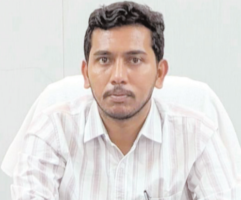
ఫిర్యాదు రాగానే, మేము ఆ సర్వే నెం 83 ను క్షేత్ర స్థాయిలో పరిశీలించామన్నారు. అక్కడక్కడ కొంత మంది