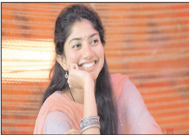
ఆమిర్ ఖాన్ నిర్మాతగా వ్యవహరించారు. 'దర్శకుడు ఈ సినిమా కోసం చాలా కష్టపడ్డారు. విజయం సాధిస్తుందో, లేదో ఎవరికీ తెలియదు. కానీ, మనం కథకు ప్రాణం పోసి చూపించగలిగామా లేదా అన్నదే నాకు ముఖ్యమైన విషయం. నా దృష్టిలో విజయానికి అదే మొదటి కొలమానం.' అని ఆమిర్ అన్నారు.