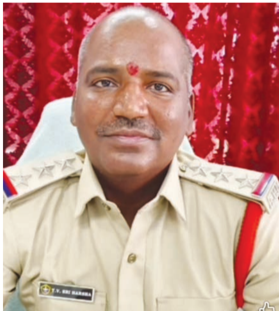
ఉద్యోగాల తొలగింపులతో హెచ్చరిక జారీ చేశారు. అనంతపురంలో ఇటీవల వెలుగులోకి వచ్చిన హానీ ట్రాప్