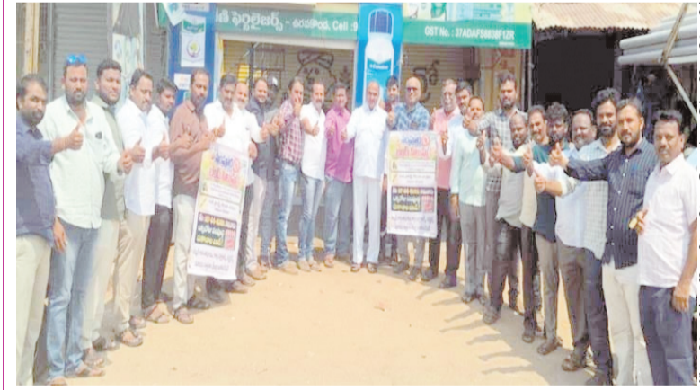
ఉరవకొండ - సూర్య వాస్తవం: స్థానిక మండల కేంద్రంలో ఎరువులు, పెస్టిసైడ్స్ మరియు విత్తనాల డీలర్ల సమస్యల పరిష్కారంపై కేంద్ర ప్రభుత్వం తక్షణ

స్వచ్ఛందంగా బండ్ నిరసన తెలుపుతున్న ఎరువుల డీలర్లు