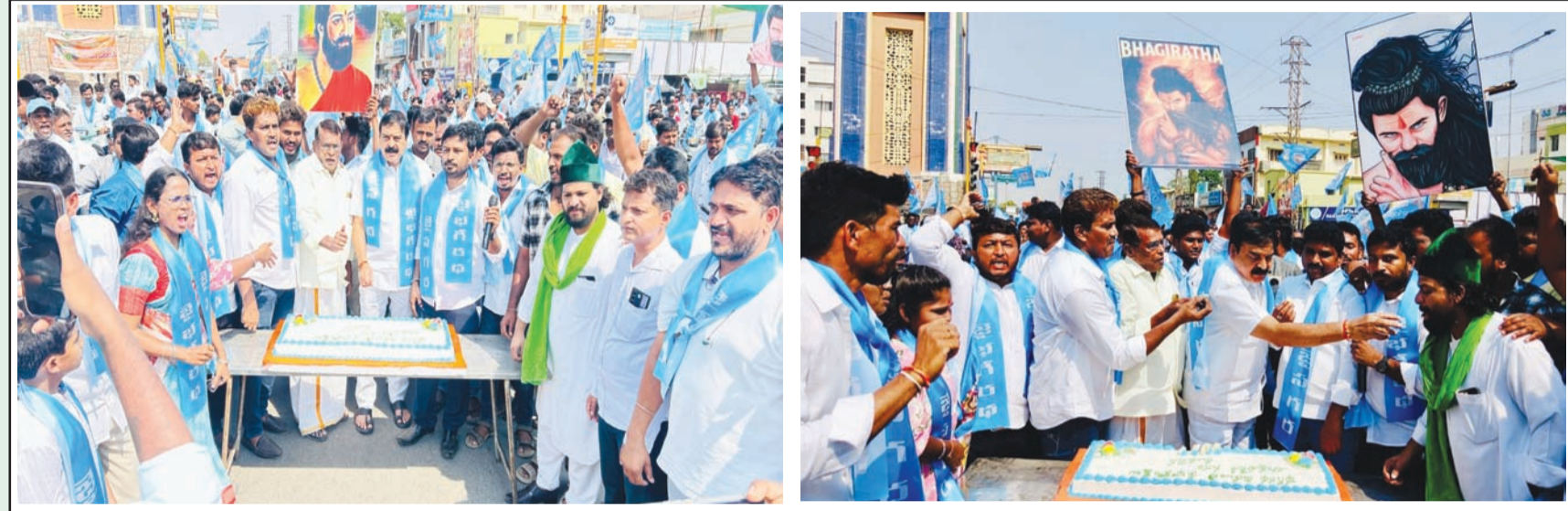
అనంతపురం - సూర్య వాస్తవం :