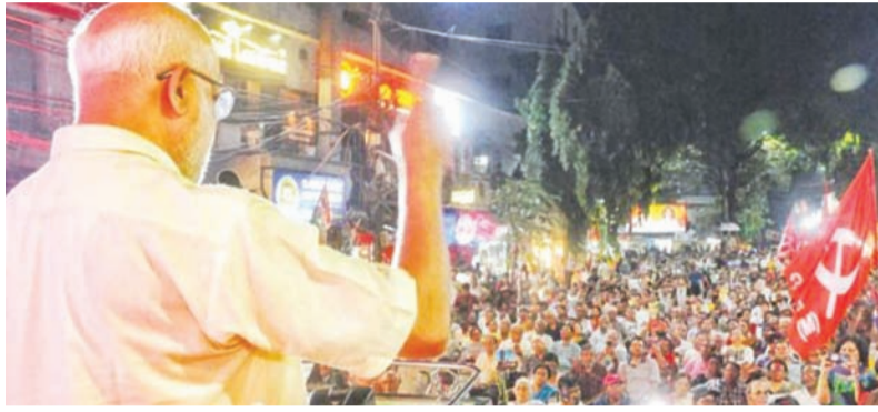
కోల్ కతా - సూర్య వాస్తవం: ప్రధాన కార్యదర్శి ఎంపి బేబీ వ్యాఖ్యానించారు. పౌరసత్వ సవరణ చట్టం (సీఏఏ), జాతీయ పౌరుల రిజిస్టర్ (ఎన్ఆర్ఐ) - మిగతా 2లో..