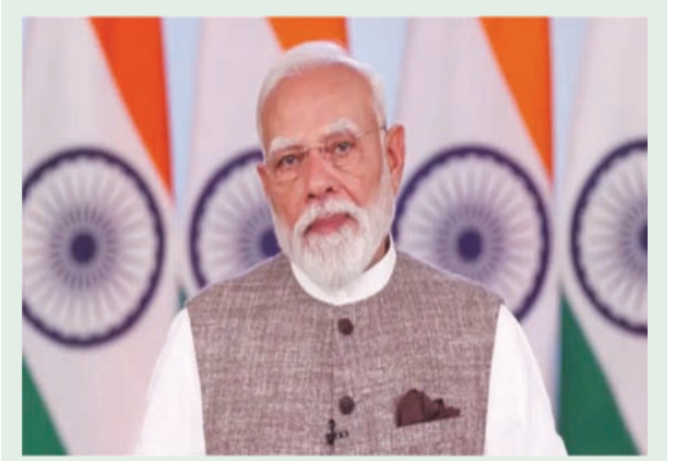
- మిగతా 2లో..

టెర్రోర్, వాషింగ్టన్ - సూర్య వాస్తవం కాల్పుల విరమణ ఒప్పందం మరొకటి గంటల్లో ముగియబోతున్న సమయంలో ఇరాన్, అమెరికా మధ్య పాకిస్తాన్ రాజధాని ఇస్లామాబాద్ లో జరగాల్సిన శాంతి చర్చలపై అనిశ్చితి కొనసాగుతోంది. అమెరికాతో రెండో విడత చర్చలు జరిపే ప్రశ్నే లేదని ఇరాన్ తేల్చి చెప్పింది. అమెరికా డిమాండ్ చిట్టా పెరిగిపోతోందని, అవాస్తవ అంచనాలు వేస్తోందని, వైఖరిని తరచూ మార్చుకుంటోందని, పరస్పర విరుద్ధ ప్రకటనలు చేస్తోందని మండిపడింది. హార్టుజ్ జలసంధిని దిగ్బంధించడం ద్వారా కాల్పుల విరమణ ఒప్పందాన్ని అమెరికా ఉల్లంఘించిందని ఆరోపించింది. చర్చల నిమిత్తం అమెరికా ఉపాధ్యక్షుడు జేడీ వాస్ నేతృత్వంలోని ప్రతినిధి బృందం ఇస్లామాబాద్ చేరుకున్నప్పటికీ ఇరాన్ వైఖరిలో ఎలాంటి మార్పు రాలేదు. తాజా పరిణామాల నేపథ్యంలో కాల్పుల విరమణ ఒప్పందాన్ని పొడిగించే అవకాశాలు కూడా సన్నగిల్లుతున్నాయి. ఇదిలావుండగా పాకిస్తాన్ ప్రధాని షేహబాజ్ షరీఫ్ ఇరాన్ అధ్యక్షుడు మసూద్