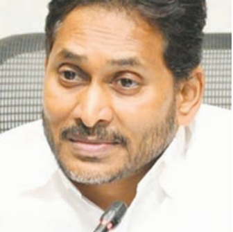
- మిగతా 2లో..

పులివెందుల - సూర్య వాస్తవం అధికార పార్టీ నాయకుల ఆక్రమాలపై న్యాయపోరాటం చేద్దామని మాజీ ముఖ్యమంత్రి, వైసీపీ అధినేత వైఎస్.జగన్మోహన్ రెడ్డి అన్నారు. మంగళవారం బెంగళూరు నుంచి పులివెందులకు చేరుకున్న ఆయనకు