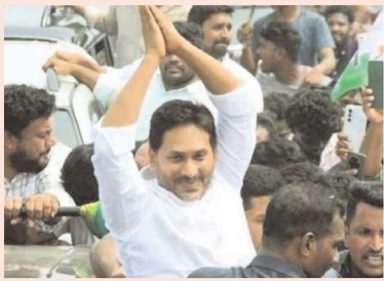
సాంతగాటికి చేరుకున్న వైఎస్ జగన్ కి