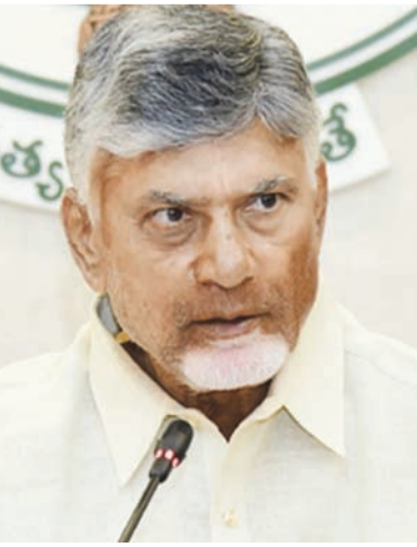
- మిగతా 2లో..

చెన్నై - సూర్య వాస్తవం అభివృద్ధి, సంక్షేమం, ఉద్యోగాల కల్పన జరగాలంటే అది ఒక్క ఎన్టీయేతోనే సాధ్యమని, తమిళనాడు రాష్ట్రానికి పూర్వవైభవం తీసుకురాగల శక్తి ఎన్టీయే కూటమికి ఉందని ఆంధ్రప్రదేశ్ ముఖ్యమంత్రి చంద్రబాబు అన్నారు. తమిళనాడు ఎన్నికల ప్రచారంలో భాగంగా మంగళవారం నాడు చెన్నైలో కేంద్రమంత్రి పీయూష్ గోయల్ తో కలిసి ఆయన మీడియా సమావేశంలో మాట్లాడారు.