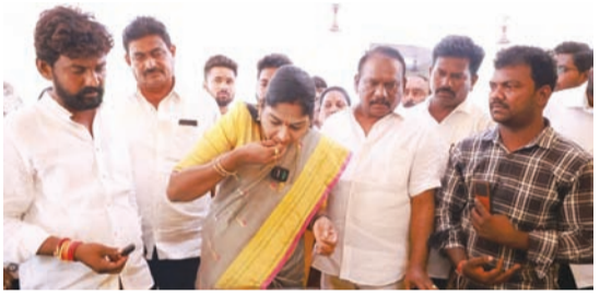
చర్యలు చేపడుతుందని స్పష్టం చేశారు. గత ప్రభుత్వ కాలంలో అన్నా క్యాంటీన్లు మూసి వేయడంతో పేద ప్రజలు