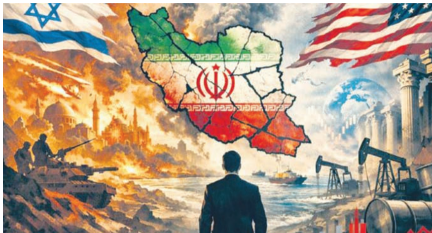
ప్రాంతానికి ప్రధాన ఇంధన ఎగుమతిదారులుగా ఉండటం వల్ల, ఈ యుద్ధం యొక్క పరోక్ష ప్రభావాలకు పొరుగున ఉన్న దక్షిణాసియా ప్రాంతం ప్రధానంగా సంక్షోభానికి గురైంది. పర్షియన్ గల్ఫ్ దేశాలలో - మిగతా 2లో..

లక్ష్యంగా చేసు కుంటోంది. అదే విధంగా ఇరాన్ ప్రతీకార దాడుల వల్ల పొరుగున ఉన్న గల్ఫ్ దేశాలు, ఇజ్రాయిల్లో కూడా ప్రాణనష్టం జరిగినట్లు నివేదికలు వచ్చాయి. అయితే.. ప్రత్యక్ష మరణాలు, విధ్వంసానికి మించి, ఈ యుద్ధం ప్రపంచవ్యాప్తంగా తీవ్ర ప్రభావాన్ని చూపింది. ముడి చమురు ధరలు విపరీతంగా పెరగడానికి కారణమైంది. మొత్తం ఆర్థిక వ్యవస్థను కుదిపేస్తుండడంతో దేశాలు సంక్షోభంలో కొట్టుమిట్టాడుతున్నాయి. గల్ఫ్ దేశాల్లో అధిక సంఖ్యలో దక్షిణాసియా జాతీయులు ఉండటం, గల్ఫ్ దేశాలు ఈ