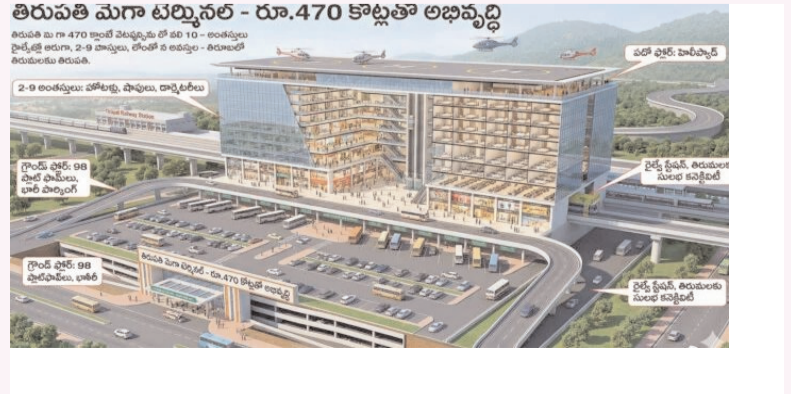
తిరుపతి మెగా టర్నలర్ - రూ.470 కోట్లతో అభివృద్ధి తిరుపతిలో రూ.470 కోట్లతో అభివృద్ధి చేసే 10-1000000 చదరంగం, 2000000 చదరంగం, 1000000 చదరంగం, 1000000 చదరంగం.