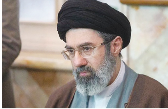
తర్వాత నిపుణుల అసెంబ్లీ సమావేశమై మొజ్తాబాను సుప్రీం నేతగా ఎన్నుకుంది. - మిగతా 2లో..

ఇరాన్ సుప్రీం నేతగా సయ్యద్ మొజ్తాబా హెస్సేనీ ఖమేనీని (56) నిపుణుల అసెంబ్లీ ఎంపిక చేసింది. అమెరికా, ఇజ్రాయిల్ సేనల దాడిలో మరణించిన అయతొల్లా అలీ ఖమేనీ కుమారుడే మొజ్తాబా ఖమేనీ. ఇరాన్ కు ఈయన మూడవ సుప్రీం నేతగా వ్యవహరించబోతున్నారు. ఇరాన్ లో ప్రభుత్వ, సైనిక వ్యవహారాల్లో తుది నిర్ణయం సుప్రీం నేతదే. మొజ్తాబా నియామకాన్ని అనేక పాశ్చాత్య దేశాలు తీవ్రంగా విమర్శించాయి. అయతొల్లా అలీ ఖమేనీ హత్యకు గురై వారం రోజులు దాటిన