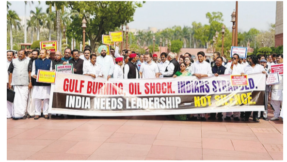
రెండోదశ పార్లమెంటు బడ్జెట్ సమావేశాలు వాడివేడిగా కొనసాగుతున్నాయి. పశ్చిమాసియా వివాదాలకు సంబంధించిన అంశాలపై చర్చకు అనుమతి ఇవ్వని కేంద్రప్రభుత్వ వైఖరిపై పార్లమెంటులో తీవ్ర వ్యతిరేకత - మిగతా 2లో..

ఇరాన్ పై అమెరికా, ఇజ్రాయిల్ యుద్ధం, ఇరాన్ ప్రతిదాడులు, గల్ఫ్ లో భారతీయుల పరిస్థితి, దేశంలో ఇంధన సంక్షోభం, ధరల పెరుగుదల తదితర అంశాలపై చర్చకు కేంద్రం నిరాకరించడం పట్ల పార్లమెంట్ లో ప్రతిపక్షాలు ఆగ్రహం వ్యక్తం చేశాయి. కేంద్ర ప్రభుత్వం.. అమెరికా, ఇజ్రాయిల్ కు లొంగిపోయారంటూ ఆగ్రహం వ్యక్తం చేశాయి.