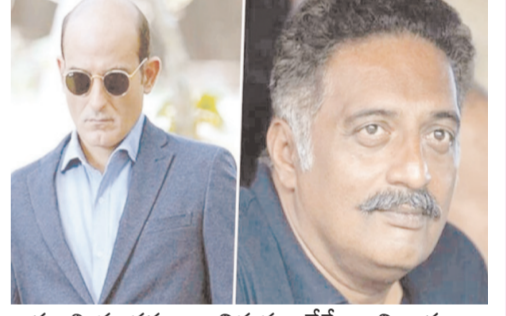
జయంతి సందర్భంగా విడుదల చేసేలా నిర్మాతలు ఏర్పాట్లు చేసుకుంటున్నారు.